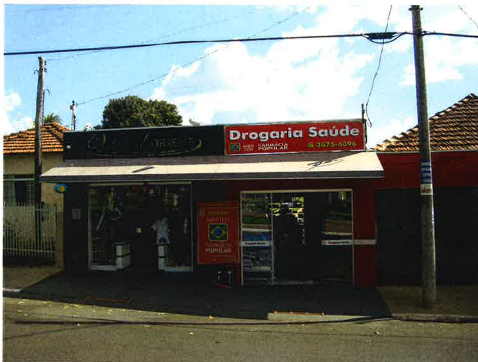
FOTOGRAFIA 5: Vista frontal do avaliando, a direita a Drogaria Saúde, outro vizinho.