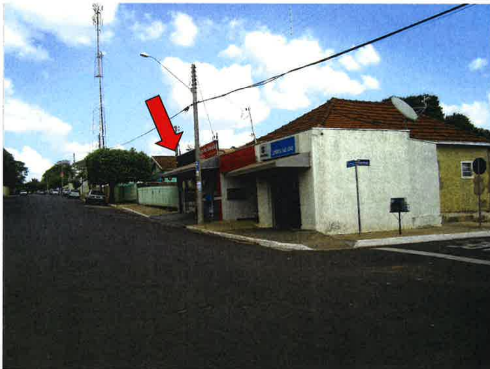
FOTOGRAFIA 2: Vista da Rua Sebastião Batista dos Santos (antiga Santo Antonio) com o avaliando a direita (seta).