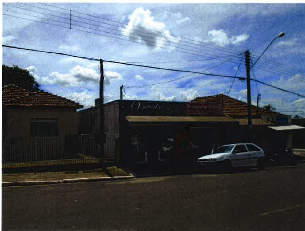
FOTOGRAFIA 3: Vista frontal do lote avaliando a partir da Rua Sebastião Batista dos Santos.