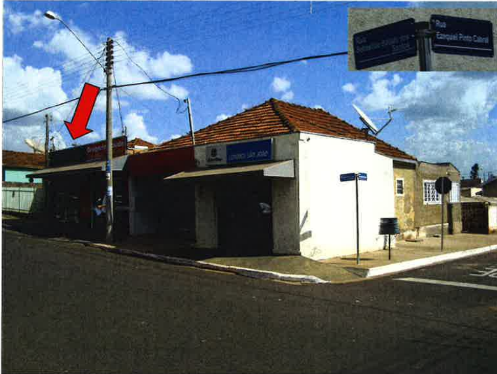
FOTOGRAFIA 1: Vista da esquina Rua Sebastião Batista dos Santos (antiga Santo Antonio) e Rua Ezequiel Pinto Cabral (antiga Três de Maio) com seta indicando o avaliando.