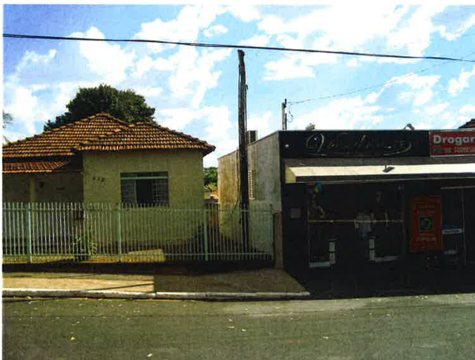
FOTOGRAFIA 4: Vista frontal do N° 412 da Rua Sebastião Batista dos Santos ao lado do avaliando.